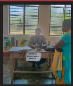
मतदार सहाय्य बूथाचेर बीएलओ