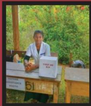
मतदान केंद्राचेर वैजकी सहाय्य उपलब्ध आसा.

मतदाराक गरजेचें आशिल्ले खंयचेय मजती खातीर आनी मतदारांक आप आपल्या मतदान केंद्राचेर येवकार दिवंक रावल्यात अशें दिसपा खातीर मतदानाच्या दिसा बीएलओ हॅल्प डॅस्काचेर उपलब्ध आसूंक जाय.