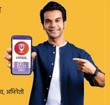
राजकुमार राव, अभिनेतो