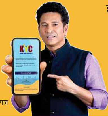
सचिन तेंडुलकर, क्रिकेट खेळगडो दिग्गज